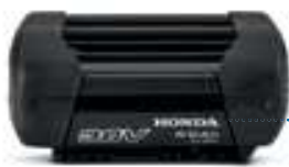
36V 6,0 Ah DP3660XA