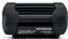
36V 4,0 Ah DP3640XA