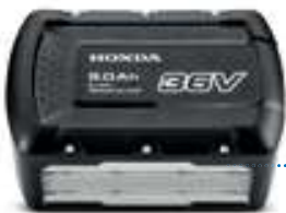
36V 9,0 Ah DPW3690XA