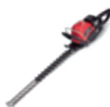
HHH 36 AXB