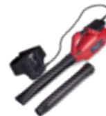
HHB 36 AXB