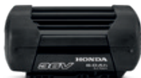
36V 6,0Ah DP3660XA