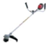
HHT 36 AXB