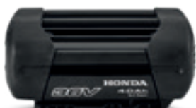
36V 4,0Ah DP3640XA

Eine Auswahl an universellen Honda Li-Ion-Akkus für die Akku-Reihe.