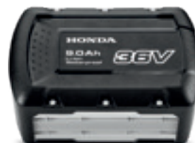
36V 9,0Ah DPW3690XA